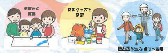
安全な場所へ避難